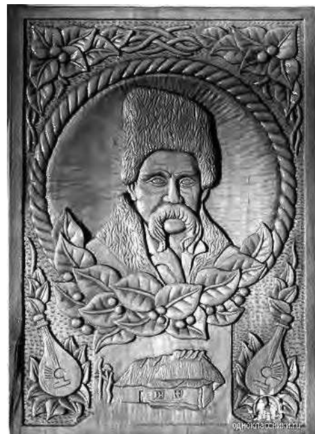
Різьблені картини Миколи Старова.